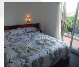
HOTEL LAS VEGAS