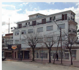
HOTEL LAS VEGAS